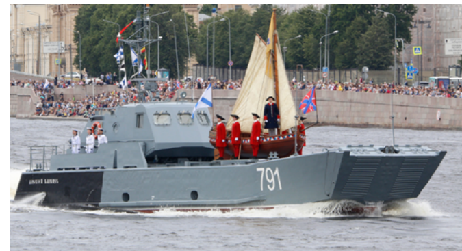
Главный военно-морской парад 2024 г.