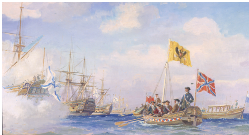
С.В. Пен. Петр I на Кронштадтском рейде принимает парад Балтийского флота с ботика 11 августа 1723 г. (ЦВММ)

Таким образом, заложенный Петром I торжественный вывод на воду «Дедушки русского флота», в наше время, при проведении Главных военно-морских парадах в день Военно-Морского Флота является продолжением славных морских традиций. ⚓