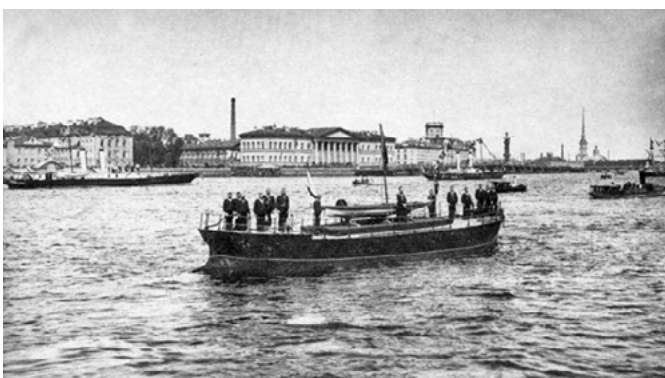
Баржа с верейкой Петра I буксируется к Адмиралтейской набережной в день 200-летия Санкт-Петербурга 16 мая 1903 года

— в 1796 году при Екатерине II — по случаю отправки эскадры адмирала Григория Спири-