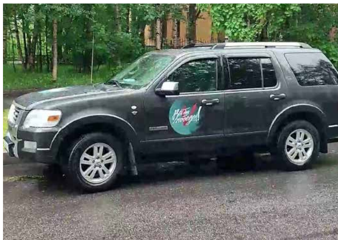
ВНЕДОРОЖНИК ДЛЯ МОРПЕХОВ СФ

Для перевозки личного состава и доставки грузов Россельхознадзор по Мурманской области отправил в зону проведения СВО автомобиль Ford Explorer.