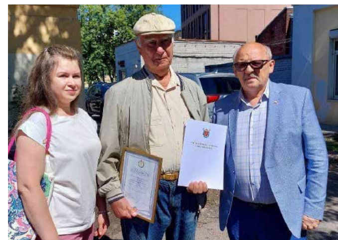
ПЕТЕРБУРГСКИЙ ПИСАТЕЛЬ ДЛЯ ФРОНТА

СВО, от тёплых вещей до дизель-генераторов и квадрокоптеров.