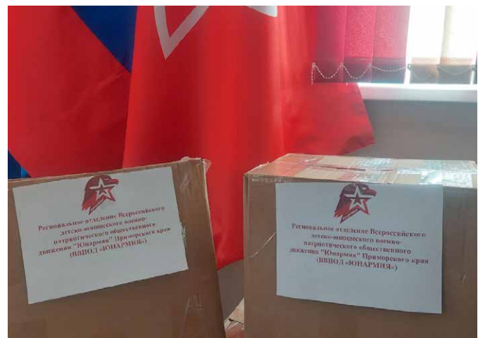
«ЮНАРМИЯ» ПРИМОРСКОГО КРАЯ

Машина прошла техобслуживание. Вместе со сменным комплектом шин на передовую также передали воинские молитвословы и обереги-ангелочки, изготовленные волонтерами молодежной общественной организации «Перспектива».