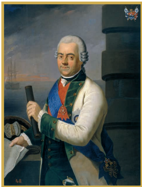
Неизвестный художник. Портрет адмирала Г. А. Спиридова. (ЦВММ)

Первая Архипелагская экспедиция — поход и стратегические действия русского Балтийского флота в Средиземном море в 1769—1774 годах во время русско-турецкой войны