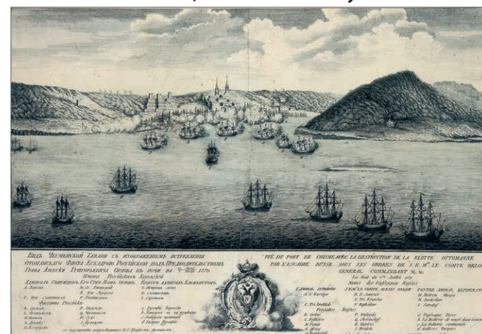
Кано. Уничтожение турецкого флота в Чесменском бою 1770 г. (ЦВММ)

сти Османской империи и население Стамбула испытывало трудности в снабжении в течение всей войны. Активные действия русского флота на берегах Эгейского моря отвлекали значительные силы турецкой армии и вынуждали её снимать часть войск с главного Дунайского театра военных действий. Действия отдельных групп кораблей русского архипелагского флота в Египте, Ливане и по берегам Эгейского моря пробудили сильные национальные чувства в на-