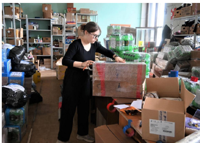
ФОНД «ВЫБОРГСКИЙ РУБЕЖ»

Фонд «Выборгский рубеж» при поддержке администрации Выборгского района Ленинградской области, а также благодаря инициативности и отзывчивости местных жителей, отправил седьмой по счету груз дополнительного имущества в зону проведения специальной военной операции с начала года.