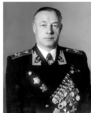
Именем выдающегося адмирала названы тяжёлый авианесущий крейсер - «Адмирал Флота Советского Союза Кузнецов», Военно-морская академия в С.-Петербурге. Приказом МО РФ № 25 от 27 января 2003 года учреждена ведомственная медаль Министерства обороны Российской Федерации «Адмирал Кузнецов».