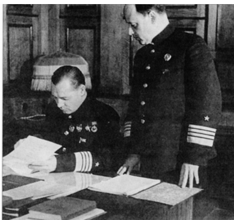
Нарком ВМФ Н.Г. Кузнецов и зам. наркома ВМФ И.С. Исаков. 1939 г.

1919 г., прибавив себе ровно 2 недостающих года стал военмором, вступив в Северо-Двинскую военную флотилию. В 1920 - 1922 гг. обучался в подготовительной школе, по окончании которой, сдав вступительные экзамены, был зачислен курсантом военно-морского училища. Окончив в 1926 г. с отличием военно-морское училище продолжил службу в Морских силах Чёрного моря. В 1929 г. поступил в Военно-морскую академию, которую в 1932 г. также с отличием окончил, вернувшись служить на Чёрное море старпомом крейсера «Красный Кавказ». С 1933 по 1936 г. – командир крейсера «Червона Украина». С августа 1936 г. по июль 1937 г. Н.Г. Кузнецов участвует в гражданской войне в Испании на стороне республиканцев – в качестве военно-морского советника. В июле 1937 г. Николай Герасимович был отозван из Испании и назначен 1-м заместителем командующего, а в январе 1938 г. – командующим Тихоокеанским флотом. В апреле 1939 г. Н.Г. Кузнецов был назначен на должность