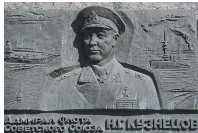
Мемориальная доска Н.Г. Кузнецову на здании ВУНЦ ВМФ «Военно-морская академия» в г. Санкт-Петербурге