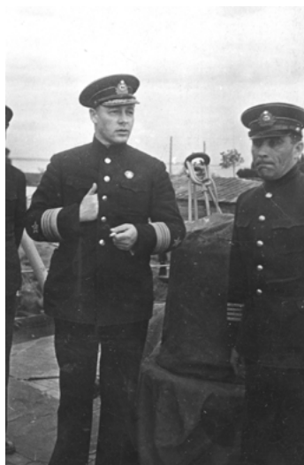
Народный комиссар ВМФ адмирал Н. Г. Кузнецов на Черноморском флоте. Август 1942 г.

нарком ВМФ. Ему было присвоено воинское звание флагман флота 2-го ранга. При его активном участии были приняты дисциплинарный и корабельный уставы ВМФ. 24 июля 1939 года по его инициативе был введен День Военно-Морского Флота. 4 июня 1940 г. постановлением №946 СНК СССР Н.Г. Кузнецову присваивается воинское звание «адмирал». Благодаря его деятельности в качестве народного комиссара ВМФ 22 июня 1941 г. Военно-Морской Флот встретил Великую Отечественную войну в полной боевой готовности, не потеряв в первые часы войны ни одного корабля. Во время войны нарком ВМФ, Главнокомандующий ВМС Николай Герасимович Кузнецов профессионально и успешно руководил ВМФ, являлся председателем Главного военного совета ВМФ, членом Ставки ВГК и ГКО. 31 мая 1944 года Кузнецову присвоено воинское звание адмирал флота. В августе 1945 года находясь непосредственно в Ставке войск Дальнего Востока, нарком ВМФ Кузнецов лично координировал действия Тихоокеанского флота и Амурской военной флотилии с войсками Забайкальского. 1-го и 2-го Дальневосточных фронтов. В 1945 году участвовал в составе советской делегации в работе Крымской и Потсдамской конференций руководителей трёх союзных держав. 14 сентября 1945 года Н. Г. Кузнецову присвоено звание Героя Советского Союза. 20 июля 1951 года Кузнецов возглавил флот