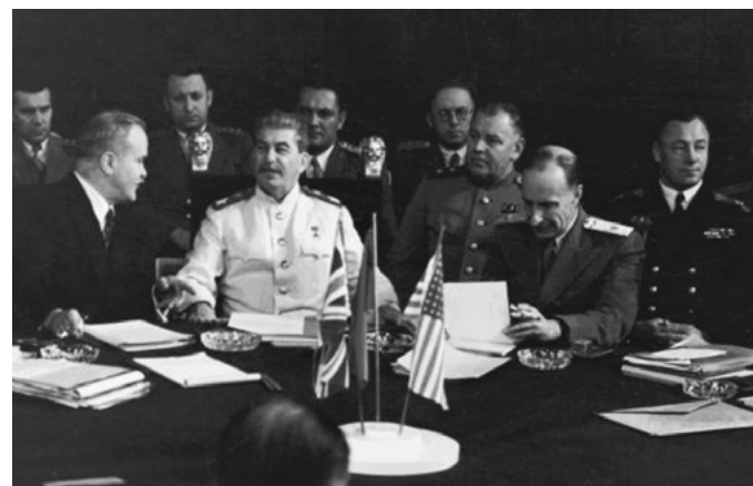
Н.Г. Кузнецов (справа) на заседании Потсдамской конференции. Июль 1945 г. как Военно-морской министр СССР. В 1953—1955 годах Кузнецов — первый заместитель Министра обороны СССР, Главнокомандующий ВМФ. 3 марта 1955 года стал Адмиралом Флота Советского Союза. В декабре 1955 года Кузнецова необоснованно сняли с должности. 17 февраля 1956 года он был понижен в звании до вице-адмирала и отправлен в отставку. Лишь 26 июля 1988 года Кузнецов посмертно был восстановлен в звании Адмирала Флота Советского Союза.

Адмирал Флота Советского Союза Н.Г. Кузнецов. 1955 г.