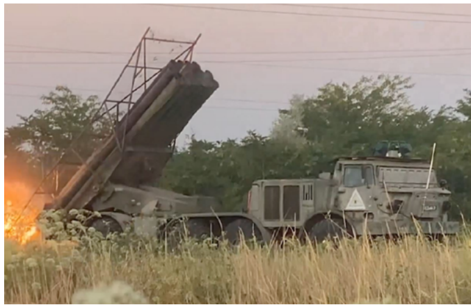
Расчет реактивной системы залпового огня (РСЗО) «Ураган» морской пехоты

Северного флота из состава группировки войск «Днепр» выполняет огневые задачи днем и ночью по уничтожению бронетехники, огневых средств, складов боеприпасов, укрепленных позиций ВСУ на правом берегу Днепра.