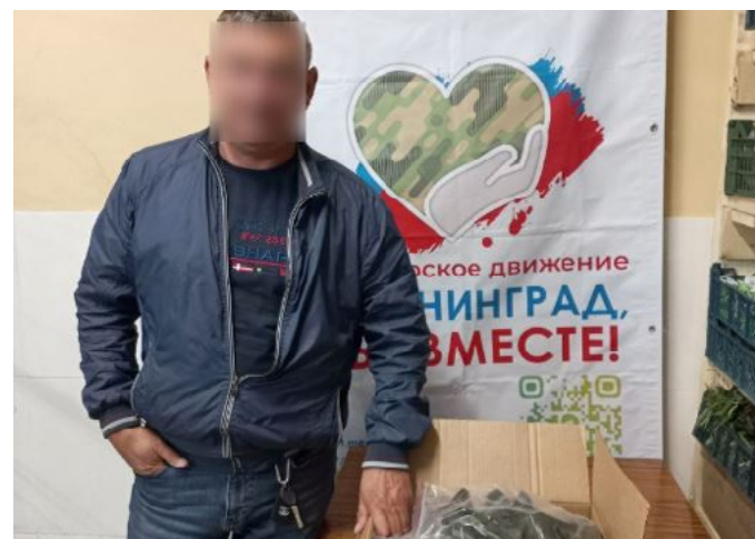
«ЛИСТВА ПРИКРОЕТ СВО»

жён солдат Приморья «Надёжный тыл» на постоянной основе проводит сборы необходимых вещей для военнослужащих, выполняющих боевые задачи в зоне проведения СВО.