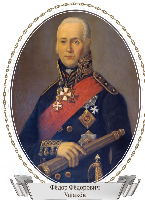
Фёдор Фёдорович Ушаков

сантные отряды русских моряков на Корфу вышли из своих укреплений и начали атаку передовых фортов французской крепости. Русские моряки захватили форт св. Рока и укрепление св. Авраама. Французское командование, потеряв за один день боя батареи острова Видо и передовые форты Корфу, решило, что дальнейшее сопротивление не имеет смысла. 3 марта 1799 года командующий французским гарнизоном генерал Шабо подписал акт о капитуляции французов. В крепости победителям досталось 105 мортир, 21 гаубица, 503 пушки, 4105 ружей, 1224 бомбы, 105 884 ядра, 620 книппелей, 572 420 ружейных патронов, 2574 пуда пороха. В порту Корфу были взяты линейный корабль «Леандр», фрегат «Брюне», полака, бомбардирское судно, две галеры, четыре полугалеры и три купеческих судна.