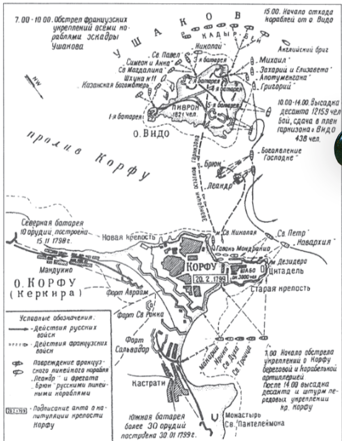
Схема штурма Корфу 1 марта 1799 года

Великий русский полководец А. В. Суворов, узнав о победе при Корфу, воскликнул: «Великий Петр наш жив! Что он по разбитии в 1714 году шведского флота при Аландских островах произнес, а именно: «Природа произвела Россию только одну; она соперницы не имеет!» — то и теперь мы видим. Ура! Русскому флоту! Я теперь говорю сам себе: «Зачем не был я при Корфу хотя мичманом?»».