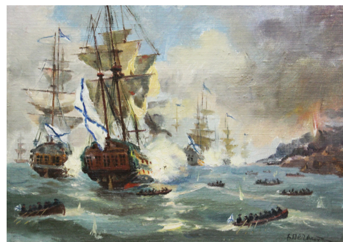
В. А. Печатин. Штурм острова Корфу эскадрой адмирала Ф. Ф. Ушакова.

Взятие Корфу наглядно показало творческий характер мастерства адмирала Ушакова. Русский адмирал показал ущербность мнения о том, что атака сильной крепости с моря невозможна. Корабельная артиллерия стала главным средством, который обеспечил подавление береговых сил противника. Кроме того, большое внимание было уделено морской пехоте, организации десантных действий по захвату плацдармов, строительству береговых батарей. Русские моряки доказали, что могут выполнять самые сложные боевые задачи. Штурм считавшейся неприступной морской крепости красной строкой вписан в историю русской школы военно-морского искусства.