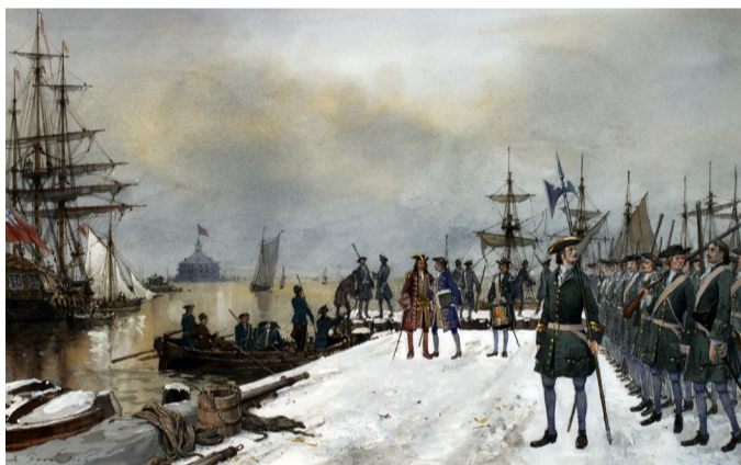
А.А Тронь. Морской полк 1705 года. (ЦВММ)

История российской морской пехоты берет свое начало в XVIII веке, насчитывая уже более трех веков. Указ о создании первого в Российской империи «полка морских солдат» для абордажной службы на кораблях был подписан тогда царем Петром I 16 ноября (27 ноября по новому стилю) 1705 года. Колыбелью регулярной морской пехоты России является Балтийский флот. В Гангутском морском сражении