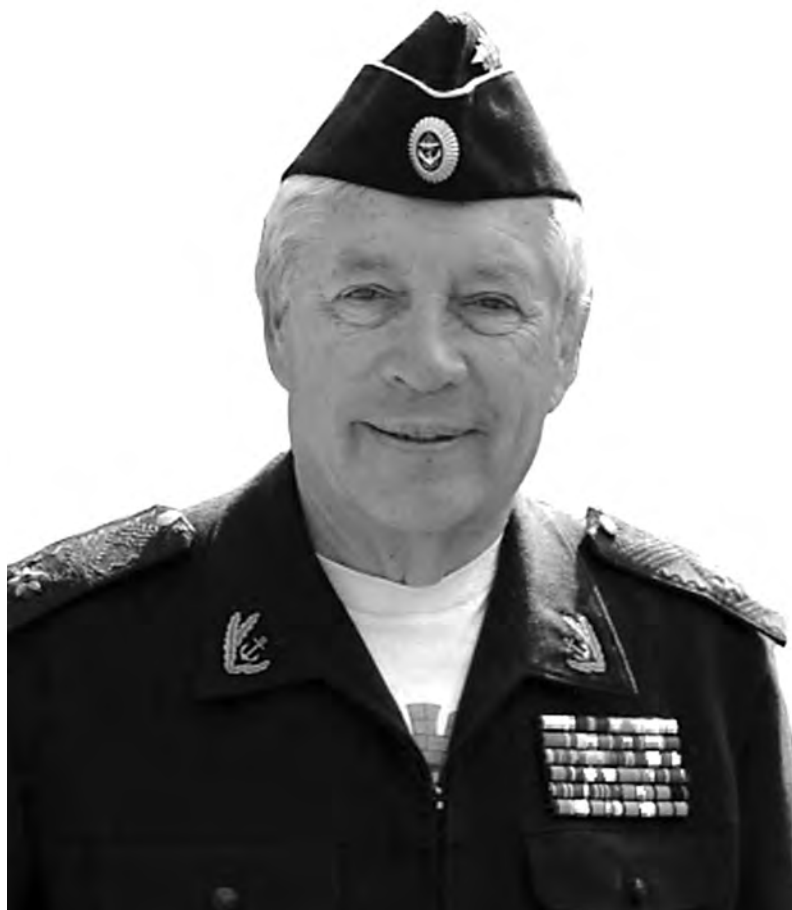
Контр-адмирал Дьяконов А.Г.